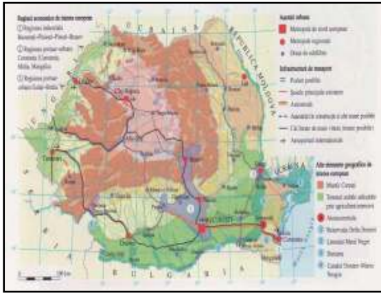
Fig. 4. România în spațiul internațional

Sub raportul utilizării resurselor naturale și al dezvoltării durabile, proiectele pot avea în vedere: