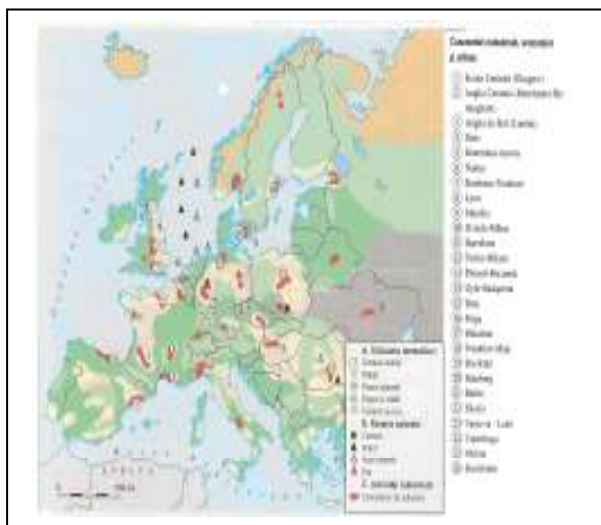
Fig. 3. Elemente ale organizării spațiului

Spre deosebire de organizarea naturală, organizarea umană este determinată de arhitectura administrativă. În cazul țării noastre, ea este formată din județe, asociate în regiuni statistice de dezvoltare (care nu au personalitate juridică administrativă).